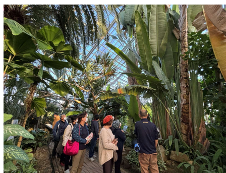
思わず見上げてしまう 大きなタビビトノキ