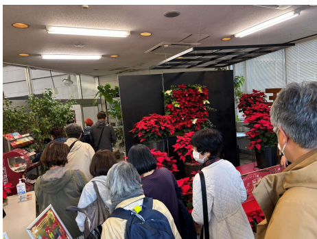
鑑賞大温室ではポインセチア がお出迎え