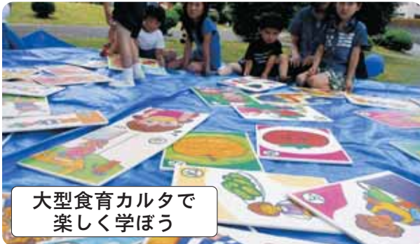
大型食育カルタで 楽しく学ぼう