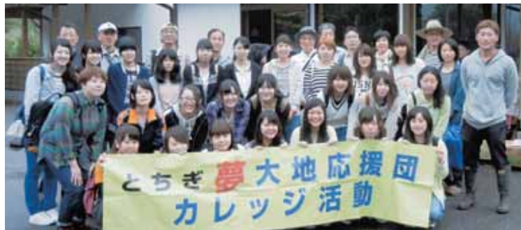
参加した学生たち（あきやま学寮体験館前で）