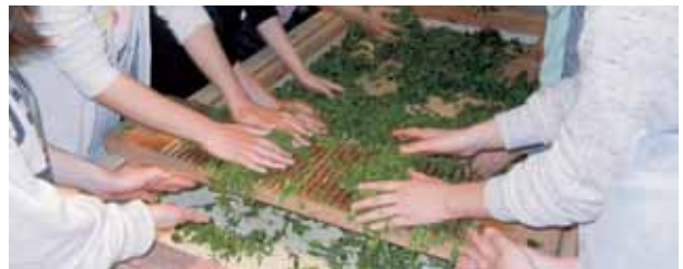
手もみ茶加工体験