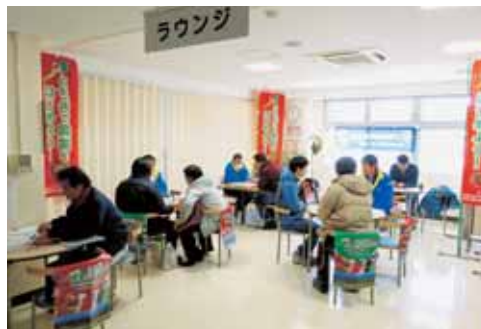
アグリプラザ新規就農相談会の様子