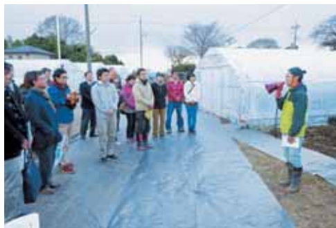
新規参入者（いちご）のお宅訪問の様子