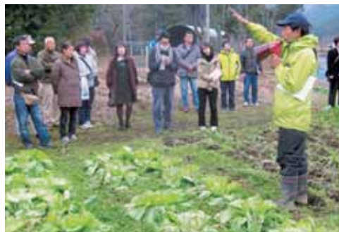
新規参入者（有機野菜）のお宅訪問の様子

取得など準備が必要となります。また、農業を始めるということは、人に雇用されるのではなく経営主になるということで、自分の経営に対して全て責任を負うことになるため、自らの努力と熱意が必要になります。このような状況を踏まえ、青年農業者等育成センター事業の一環として、本県農業の担い手確保を図るため、幅広い新規就農希望者を対象に各種新規就農相談会や現地セミナー等を実施しています。