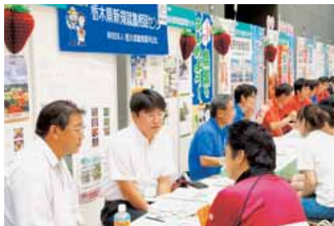
新・農業人フェア相談会の様子

栃木県の新規就農者は、平成27年度では251名、このうち非農家からの新規参入者は40名で全体の16%を占めています。加えて、県や関係機関の支援体制の整備、支援活動が充実してきており、新規参入者は年々増加傾向にあります。一方、農業を新たに始めるには、就農相談や調査を経て、技術の習得、資金の確保、農地の