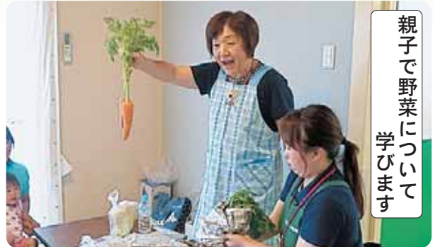
親子で野菜について 学びます