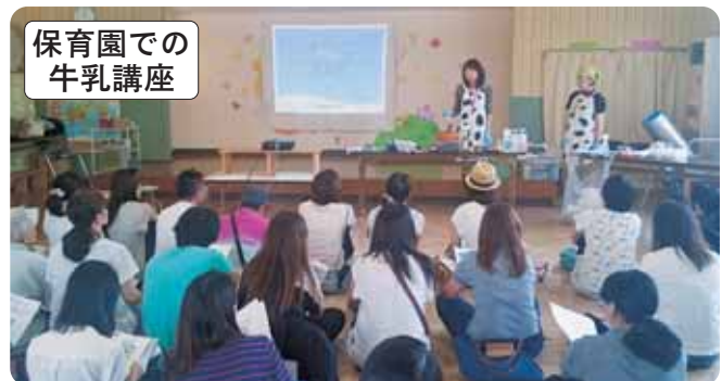
保育園での 牛乳講座