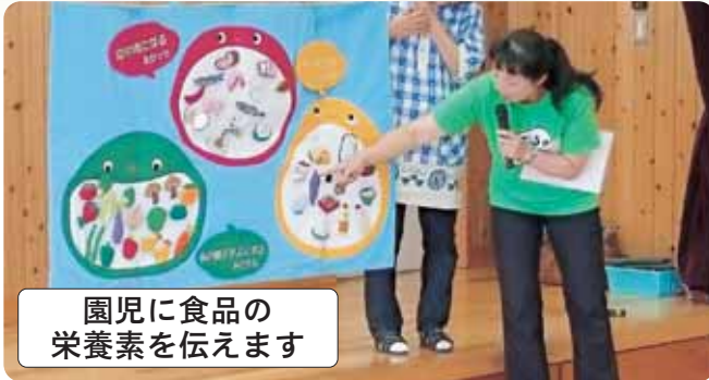
園児に食品の 栄養素を伝えます