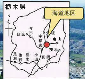
海道地区をドローンで撮影

海道町では、農地整備にあわせて 「いちご団地」創設を計画しており いちご経営者を募集しています