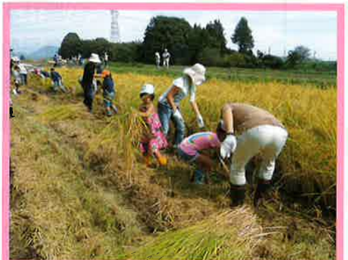
③ 農業体験受入、栽培指導、相談等