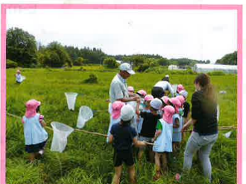
⑥ 田園の動植物等の観察・説明、その他分野の①～⑤に入らないもの