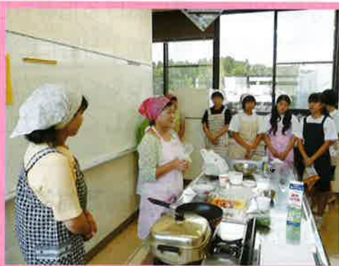
② 郷土料理の紹介、食と農に関する伝統文化の指導等