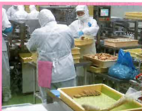
⑤ 食品衛生に関する指導、相談等