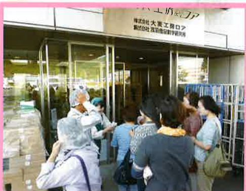
④ 工場見学の受入、流通関係の説明等