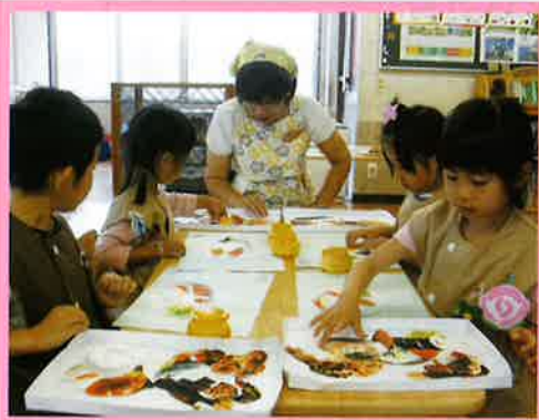
① バランスのとれた食生活の相談、指導など