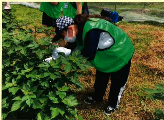
▲ 宇都宮クラーク高等学院の生徒さん

ある学生さんからは「中山間地域があることは知っていましたが、たくましく生活する関係者に感銘を受け、今後も何か関わることがあれば、お手伝いしたい」と感想をいただきました。