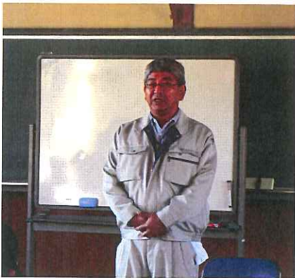
県農村振興課 福田GL

「今日の体験を生かして、頑張ってください」とのあいさつに対し、「貴重な体験をさせて頂き、ありがとうございました。がんばります。」との感謝と抱負の言葉に、たかばたけグリーンツーリズム協議会の方々は心強くしていました。