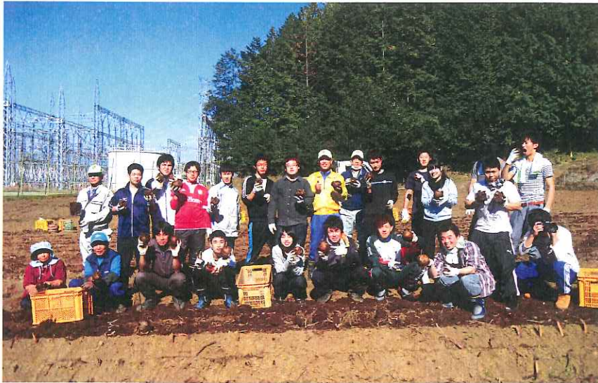
コンニャク玉を持って記念写真