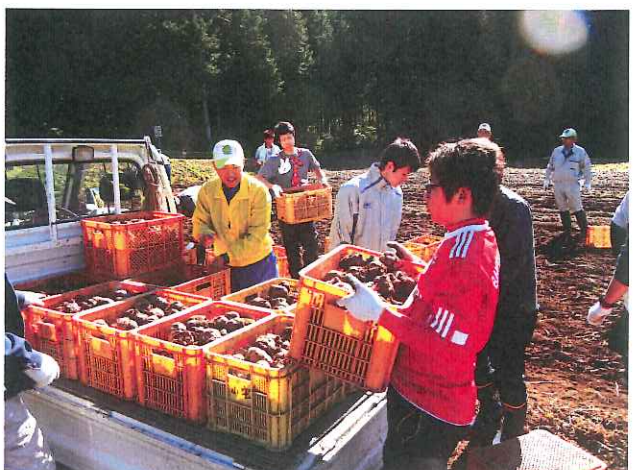
コンテナを軽トラックに積み込む