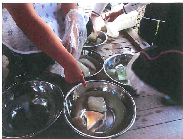
20分煮て 出来上がり