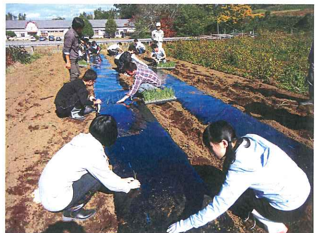
菱沼会長から玉ねぎの話、定植の仕方を聞いて 植え付け作業