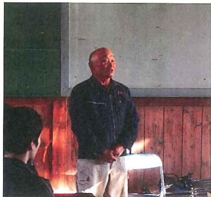
たかばたけ協議会の方