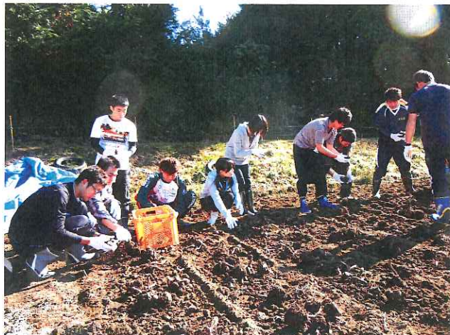
土をとり 良い物が良くみて