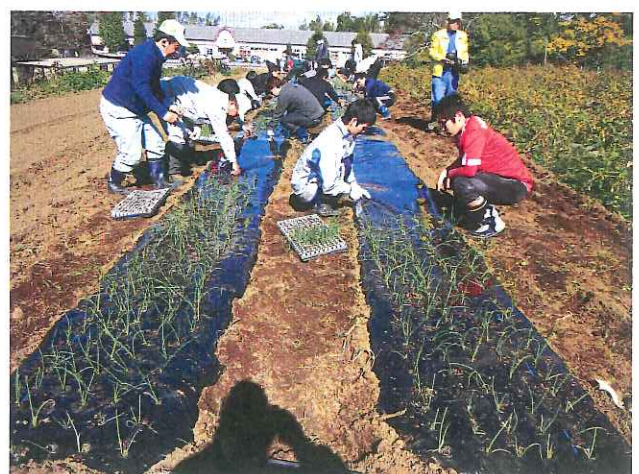
きれいに定植しました