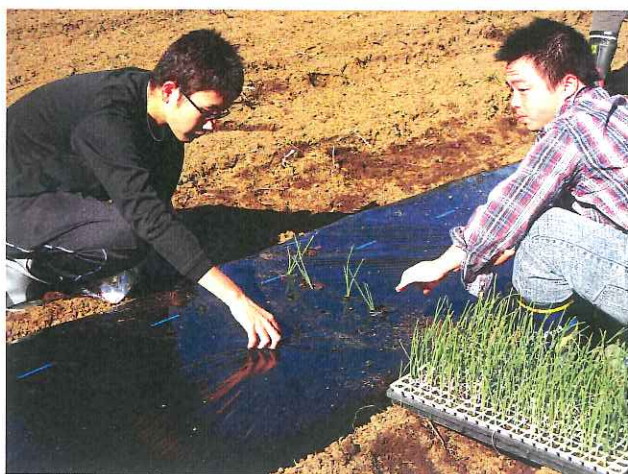
黒マルチ穴をあけ 1本1本に