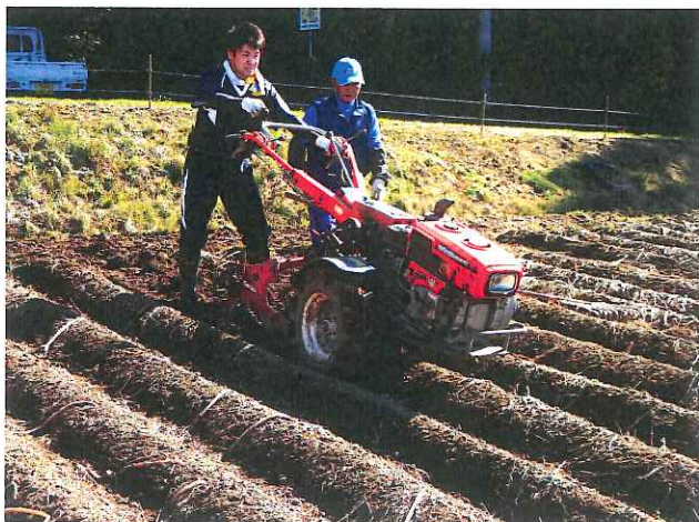
掘り取り機の練習