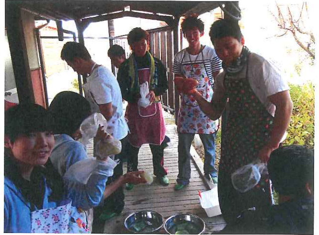
おみやげをゲット