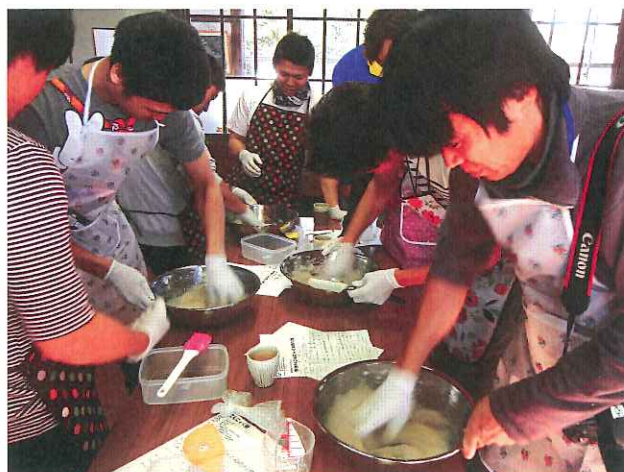
炭酸ソーダを入れ良くかき混ぜる そして・・・