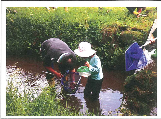
何かいるかな？親子で水生生物を採取