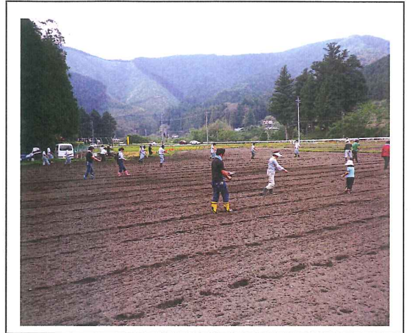
休耕田40aに小松菜の種まき