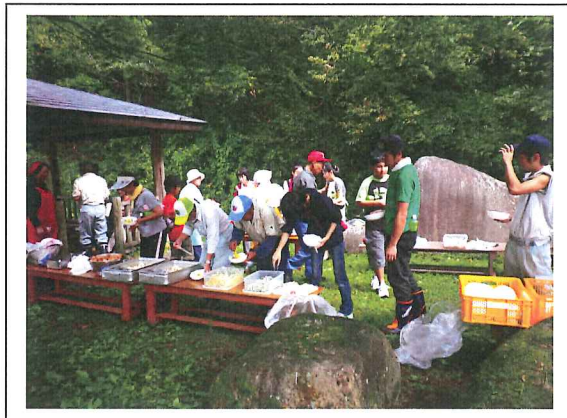
昼食を美味しくいただきました