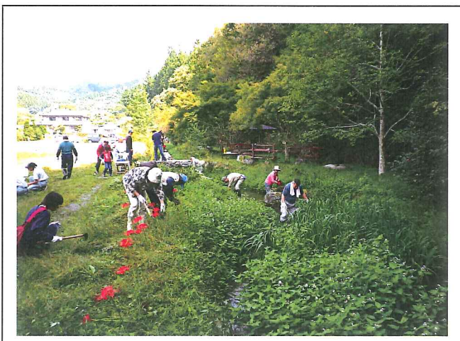
水路清掃をする夢大地応援団