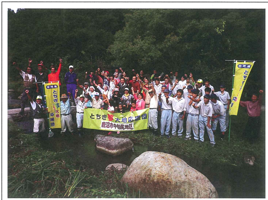
クリーンになったホタルの生息地と関係者全員での記念撮影