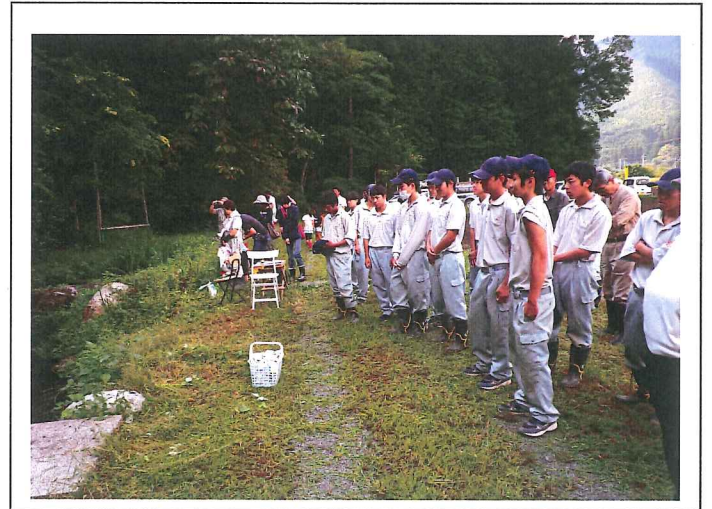
ボランティア活動に参加した県立鹿沼南高生徒一同