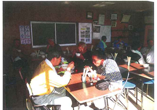
作業終了後のランチタイム