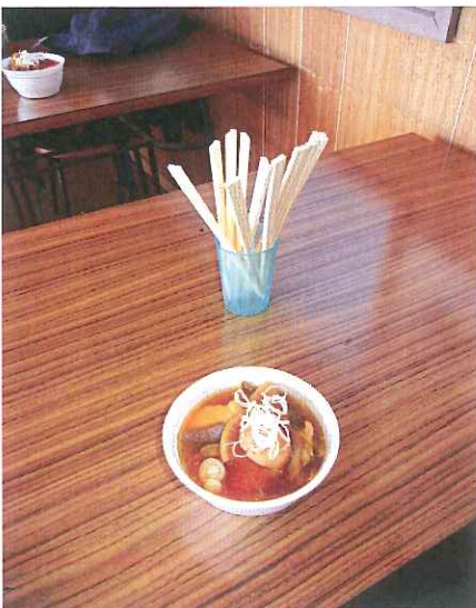
すいとんの御馳走