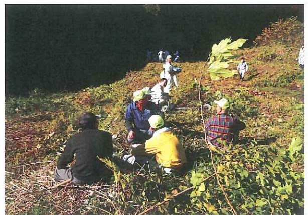
お茶を飲んで休憩タイム