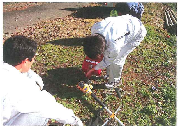
作業開始前の燃料補給