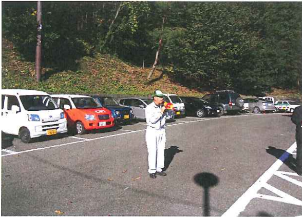
那須烏山市 堀江課長