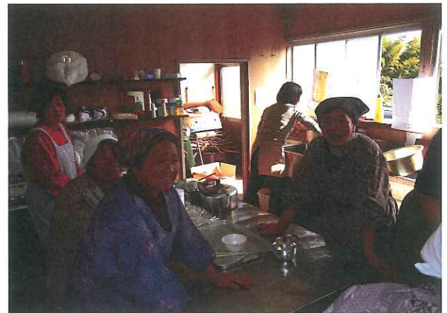
すいとんを調理してくれた地元女性のみなさん