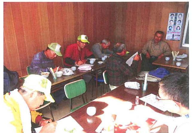
アンケート記入のみなさん