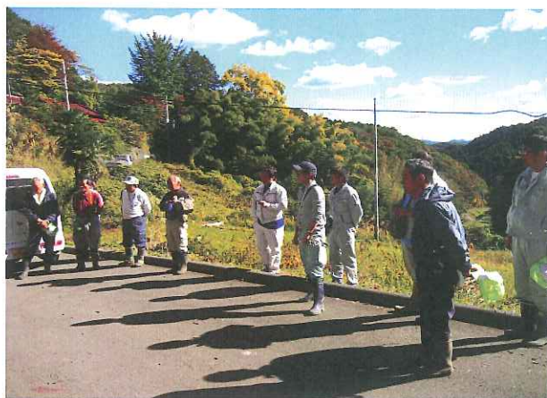
閉会式 みなさんお疲れ様でした