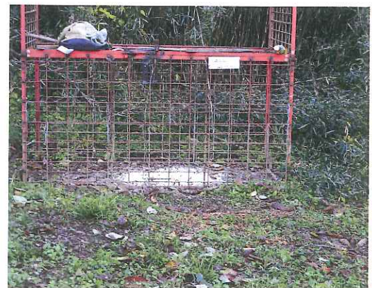
イノシシ捕獲用の箱ワナ