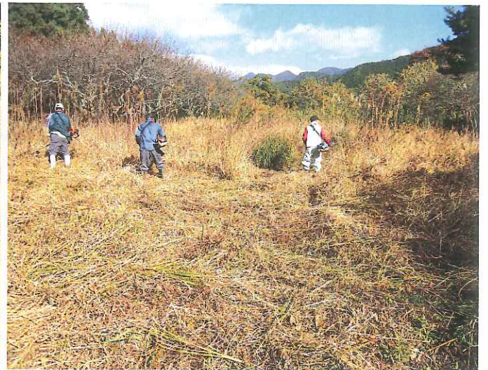
背丈の倍の篠竹伐採