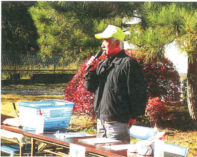
松島町会長 歓迎あいさつ