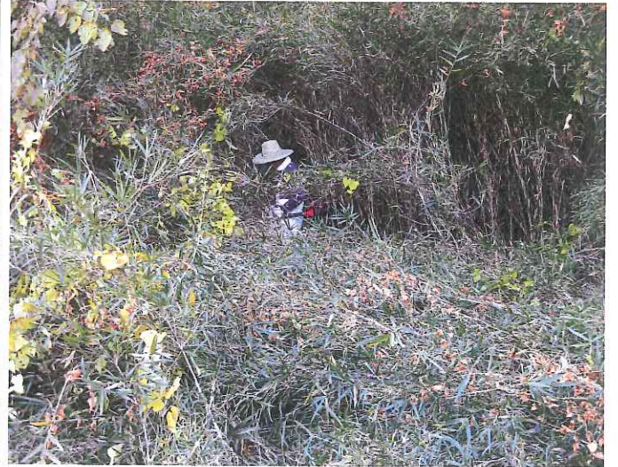
雑灌木の刈り払い